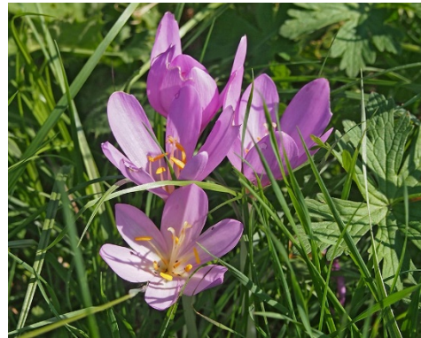
ocún jesenní jedovatý!