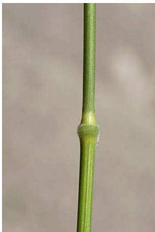
stéblo s kolénkem