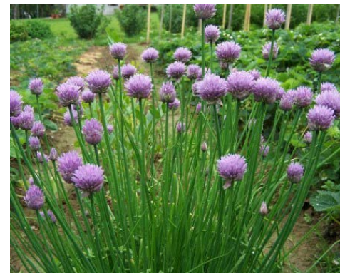
pažitka pobřežní („šnytlik“)