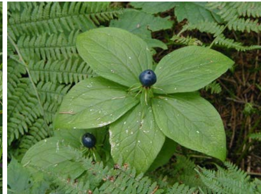
vraní oko čtyřlisté jedovaté!