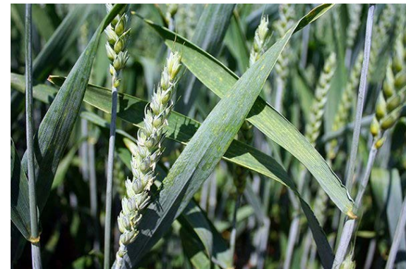
úzké čárkovité listy