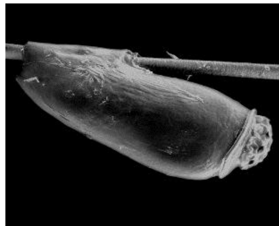
hnida přilepená na vlasu