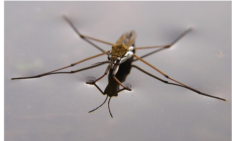
bruslařka obecná (zaměňována za vodoměrku)

znakoplavka pohybuje se těsně pod hladinou „bříškem vzhůru“