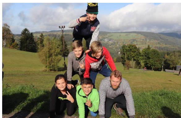
6.A a teambuilding na Benecku