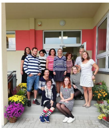
Pruhovaný den, aneb i učitelé jsou hraví