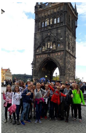
Exkurze 7.A do Muzea Karlova mostu