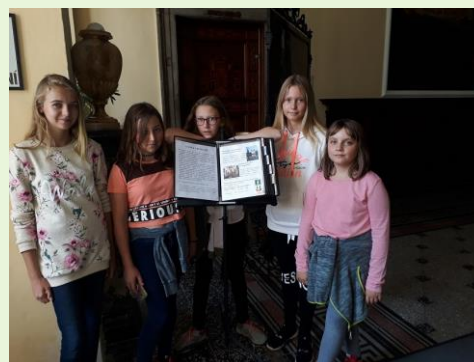
Vrchlabský zámek – sídlo MÚ

Za prohlídku stojí i zámek, známý čtyřmi obrazy s medvědy. V zámku uvidíte kachlová kamna s biblickými motivy. Prostředí kolem zámku je nádherné, doporučujeme návštěvu parku. V zámku sídlí v současnosti Městský úřad.