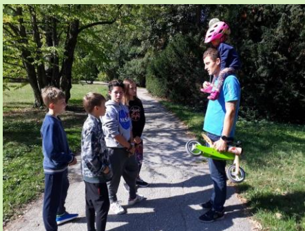
Reportéři v akci

Ve čtvrtek šestého září jsme se rozhodli, že si vyrazíme do Vrchlabí na novinářskou exkurzi. Vybrali jsme si reportáž z oblasti dopravy a vyrazili do ulic nasbírat materiál. Postupně jsme se dozvěděli, že to není úplně v pořádku – nejvíc lidem vadí ubývající parkovací místa, ale také přibýtek pro nepotřebné retardéry. A pozor máme tu i perličku!! Jeden pán nám sdělil, že má kolo ze „třiašedesátýho“, a že je to nejlepší dopravní prostředek. ☺